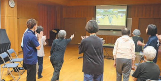
簡単な操作でボウリングゲームを楽しめます

◇ ◇ ◇ 来年2月の実施日は左下表の通りです（各先着20人）。 対 区内に住む65歳以上 申 区ホームページ（「城南区 デジタルゲームでフレイル予防」で検索）から申し込むか、運営事務局（桜十字病院内、☎080-8955-9152 F 791-1105✉sacra.reha@sakurajyuji.jp）へ電話、ファクス、メールのいずれかで申し込みを。