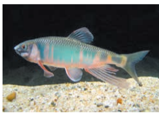
樋井川で見られる、コバルトブルーの体が特徴の魚「オイカワ」

☒区内に住む小学生と保護者 ☒無料 ☒7月10日までに、区ホームページから申し込み ☒スマホはこちらから