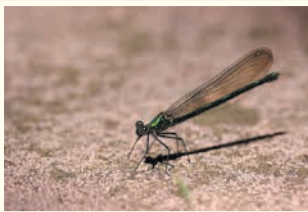
カワトンボ (油山市民の森)