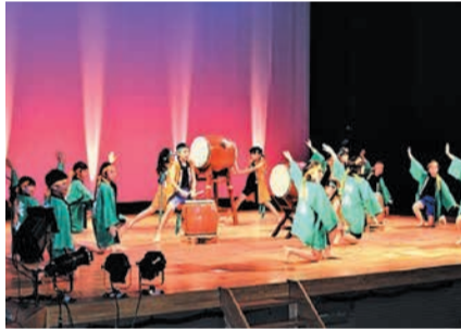
力強く和太鼓を披露する子どもたち (昨年)