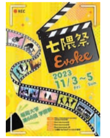
七隈祭のポスター

福岡大学学園祭「七隈祭」を開催します。今年は、「Evoke(イヴォーク)」をテーマに、ダンスや歌を披露するステージ、eスポーツ対決などさまざまなイベントを行います。食べ物などのバザー出店もあります。