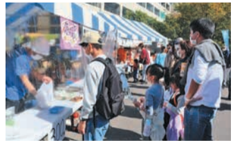
多くの人でにぎわう会場(昨年)

校区の団体が出店します。焼きそばや綿菓子のほか、サンマの炭火焼や焼き芋など、秋の味覚も楽しめます。福祉施設などで作られた菓子や手芸品なども販売します。