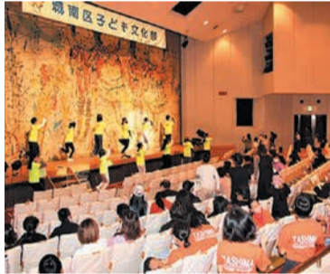
昨年も会場が一体となってダンスで盛り上がりました