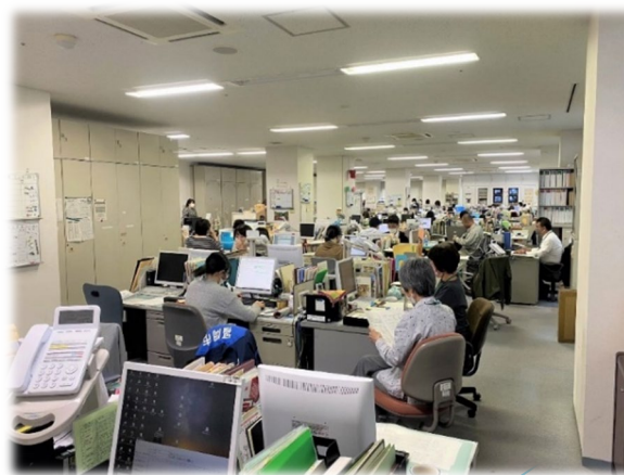
児童相談所 執務室