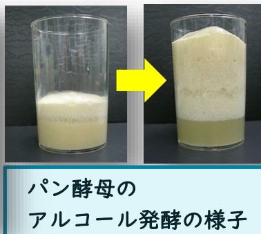
パン酵母の アルコール発酵の様子