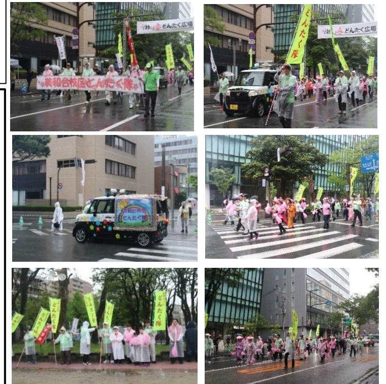
(どんたく推進委員会)