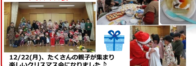
12/22(月)、たくさんの親子が集まり 楽しいクリスマス会になりました♪