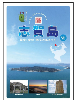
志賀島パンフレット