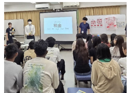
日本語学校での生活講座