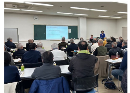
自治会・町内会長研修