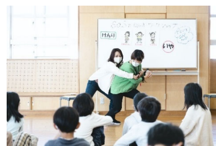
子どもへの暴力防止プログラム