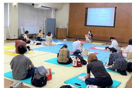
初めての子育てビギナーズ教室