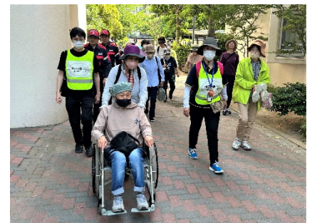
要支援者の避難訓練