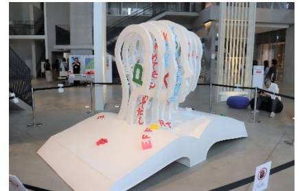
東区芸術文化祭メインビジュアル (製作:九州産業大学)