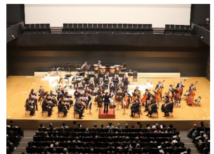
なみき芸術文化祭

東区が有する歴史・文化や自然などを積極的に情報発信するとともに、東区芸術文化祭などの開催により、賑わいにあふれ、地域の魅力を生かしたまちづくりを推進します。