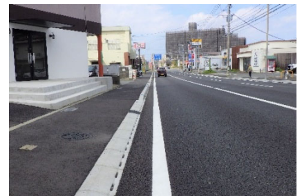
道路のバリアフリー化