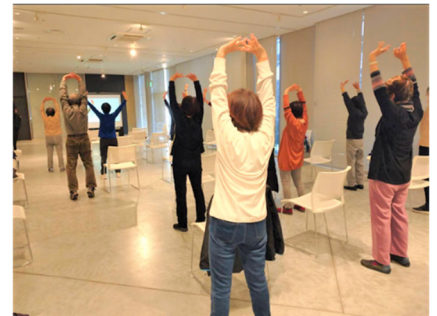
よかトレ実践ステーション