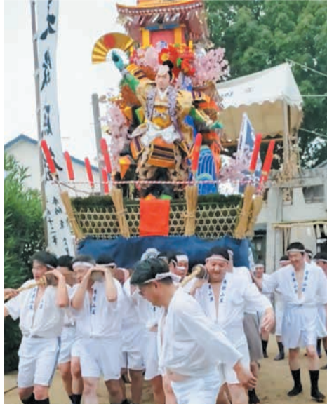
前面(山)は武将、後面(見送り)は姫の人形が飾られます

☎ = 日時、期間 ㊦ = 場所 ㊦ = 対象 ㊦ = 定員 ㊦ = 料金、費用 ㊦ = 申し込み ㊦ = 問い合わせ ㊦ = ファクス ㊦ = メール ㊦ = ホームページ ㊦ = 託児 ㊦ = 持参 ㊦ = 受付時間