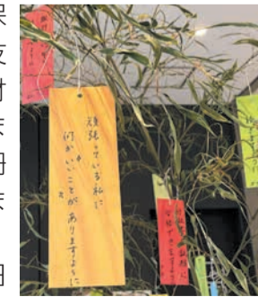
短冊に願いを込めて

立花山・三日月山保全ボランティア「楽友会」の皆さんが間伐材で七夕飾りを制作しました。七夕飾りの短冊に願い事を書いてみませんか。