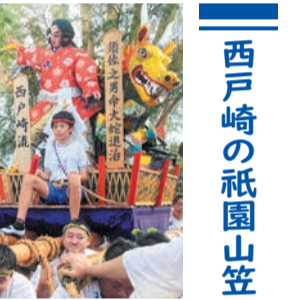
西戸崎の祇園山笠

今年(山笠)の山笠は、7月19日(日)の午後3時59分にスタートします。これまで大人のみで運行していたかき山に、昨年「台上がり」や「右写真」や「先走り」の大役を努める小学6年生が加わりました。西戸崎の山笠をさらに盛り上げ、「オイサ、オイサ」の掛け声と共に町を駆け抜けます。