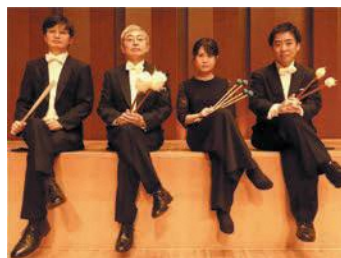
打楽器アンサンブルの九州交響楽団メンバー

28日(日)午前10時～正午には、九州交響楽団メンバーによる打楽器アンサンブルのステージが行われます。曲目は、ハチャトゥリャン作曲「剣の舞」、エックハルト・コペツキ作曲「蛇の歌」など。クラリネット、コントラバス、ピアノおよび津軽三味線が融合した音楽も楽しめます。📄抽選400人🆓無料📄往復はがきかメールで住所、氏名、年齢、電話番号を区生涯学習推進課(☎645-1144 📠651-5097📧h-gakushu@city.fukuoka.lg.jp)へ。10月29日(金)必着。グループでの申し込みは3人まで。年齢制限はありません。3歳未満は保護者と同じ席となります。