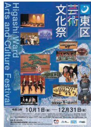
東区芸術文化祭のポスター

区は、気軽に芸術文化に触れることができ、心豊かに生き生きと暮らせるまちづくりを進めるため、10月から12月にかけて東区芸術文化祭を開催します。音楽、演劇、舞踊、写真展などさまざまなイベントが行われます。また、期間中はなみきスクエア(千早四丁目)で九州産業大学の学生が制作したオブジェを展示するほか、一部の校区で文化祭も開催されます。文化の秋、芸術の秋をお楽しみください。詳しくは、区ホームページ(「東区芸術文化祭」で検索)や、区役所、なみきスクエア、区内公民館で配布するリーフレットをご覧ください。右コードからもアクセスできます。☎区企画振興課 ☎645-1037 📠651-5097