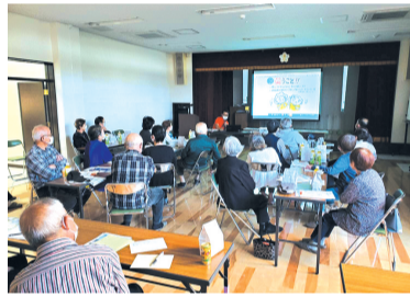
宮松会館で行われた認知症ミニ講話

前講座開催のほか、地域カフェへのスタッフ派遣など地域行事のお手伝いを行っています。