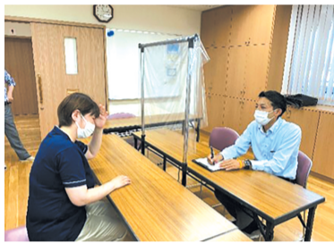
香椎浜公民館で行われたお気楽相談会

「松の実ネットつながるっ隊」は令和元年8月に発足しました。宮松・松島校区の20事業所が参加し、医療や介護等の出