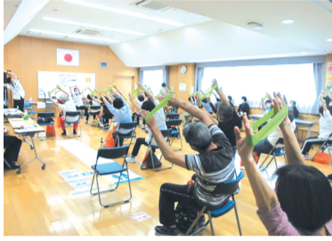
香椎下原公民館で行われた体力測定会

📅=日時、期間 📍=場所 👤=対象 👤=定員 💰=料金、費用 📄=申し込み 🗨=問い合わせ 📠=ファクス 📧=メール 🏠=ホームページ 📞=託児 🕒=持参 🕒=受付時間