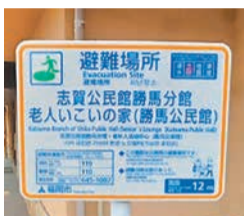
避難場所には看板を設置しています

避難所は、自治体が災害の種類から安全な施設を選んで開設します。災害発生時に自治体が発令する避難情報をご確認ください。外出や移動が難しい場合は、一定の安全が確保された屋内に留まることも、一つの避難方法です。