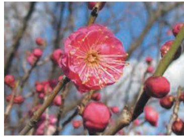
アイランドシティ中央公園の花木園(香椎照葉四丁目)に咲く紅梅(昨年)