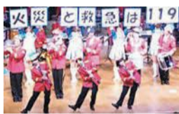
昨年のコンサート

市消防音楽隊の演奏中に火災が起きたと想定して、避難訓練を行います。詳細は、ホームページ(「なみきスクエア公式」で検索)を確認を。📅2月21日(日)午後1時半～3時📄先着300人📄無料📄2月2日(火)午前9時以降にはがきかファクスに、参加者全員の氏名、住所、電話番号を書いて、問い合わせ先へ。📍📄なみきスクエア(〒813-0044千早四丁目21-45) ☎674-3981 📠674-3972