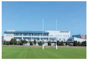
クラブハウスとグラウンド

日本ラグビーフットボール協会が運営するJAPAN BASE(香椎浜ふ頭一丁目)は、ラグビー各カテゴリーの日本代表チームの強化・育成の拠点です。ラグビーだけでなく、スポーツ全般の振興や、地域コミュニティの交流の場としての機能もあります。詳しくはJAPAN BASEのホームページをご覧ください。