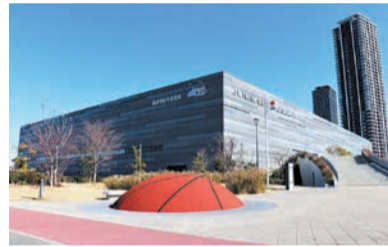
照葉積水ハウスアリーナ

バスケットボールBリーグのライジングゼファーフクオカの本拠地は、アイランドシティの