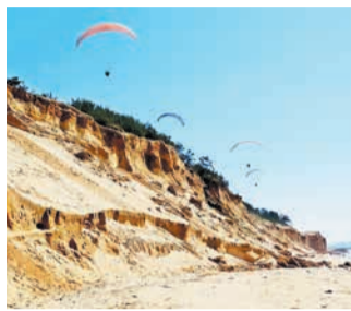
頭上を飛び交うパラグライダー

さらに西へ進むと、切り立った砂の断崖が眼前に迫ります。海面の変化や波と風による浸食と堆積が、長い年月をかけて繰り返され、形づくられたと考えられ、異世界を思わせるその景観は人々を惹きつけます。天気の良い日には、パラグライダーが頭上を飛び交うこともあります。断崖のさらに西の平坦な場所が、奈多砂丘B遺