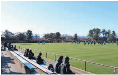
雁の巣での公開練習

サッカーJリーグのアビスパ福岡のクラブハウスと練習グラウンドは、雁の巣レクリエーションセンター内(大字奈多)にあります。本社は福岡フットボールセンター内(香椎浜ふ頭一丁目)です。