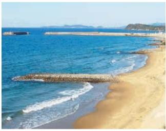
奈多の波止 (奥は奈多漁港)

玄界灘に面した奈多漁港の西側には、海の中道の長い砂浜が続いています。かつて「鳴き砂の浜」として知られていた奈多の浜を歩くと、四本の石積みのでき崩れ「奈多の波止」が崩れかけながらも荒波に抗うように、海へと延びています。漁港ができる前は、漁船は砂丘に引き揚げられ、係留されていました。