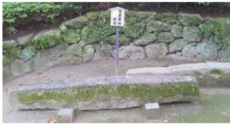
碓石（手前）と元寇防塁の再現（奥）