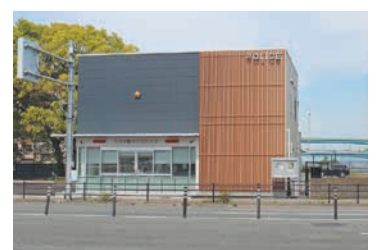
箱崎宮前交差点南西側

4月8日(月)に東警察署小松町交番が、「箱崎宮前交番」=右写真=として東浜1-4-26に移転しました。