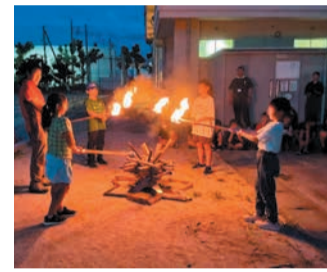
こども防災キャンプ

自治会・町内会は、自分たちの住む地域を住みよい町にするために、地域住民によって自主的に結成された団体です。防犯パトロールや防災活動、住民の交流を深めるお祭りなど、地域住民の協力でさまざまな取り組みが行われています。また、集められた会費は、防犯灯の設置・管理や清掃活動など、住みやすいまちづくりに活用されています。