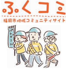
福岡市地域コミュニティサイト

市は、市民が気軽に地域活動の情報を入手できるように、地域コミュニティサイト「ふくコミ」を運営しています。住所を入力すると、自分の住む地域の自治会・町内会が分かります。校区データ集から公園や医療・福祉施設、防災マップなどの情報も知ることができます。