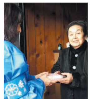
高齢者宅を訪問する民生委員

民生委員・児童委員は、地域から推薦され、厚生労働大臣の委嘱を受けたボランティアで、区内で約450人が活動しています。