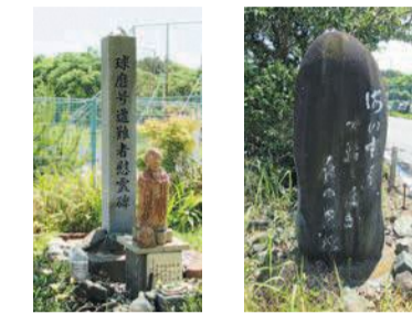
球磨号遭難者慰霊碑 建設の石碑

現在、飛行場跡地には雁の巣レクリエーションセンターや福岡航空交通センターなどの施設が整備されています。