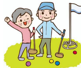
高齢者会グラウンドゴルフ