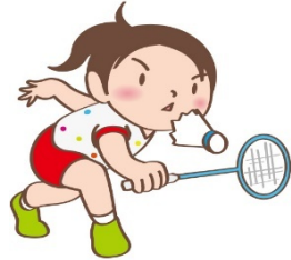
バドミントン大会