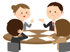
会長会・自治協議委員会