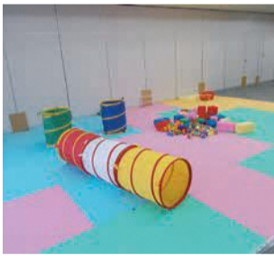
おもちゃで自由に遊べます

子どもの発達が気になる保護者が一息つける空間です。交流会や親子遊びを行います。 ☎5月14日(金)午前10時15分～11時15分 所 区保健福祉センター 問 区地域保健福祉課 ☎419-1100 F441-0057 区内に在住または勤務する保護者と未就学児。保護者だけの参加も可 先着15組 電話か、ファクスに参加者全員の応募事項を書いて4月15日(休)午前9時半以降に同課へ。