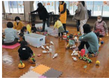
子どもたちもリラックスして遊んでいます

子育て交流サロン 公民館など区内24カ所の身近な場所で、定期的開催されています。地域の子育てサポーターが見守る中で乳幼児の親子が自由に過ごせます。 「那珂南子育て交流サロン」は、毎週金曜の午前10時半～午後12時半に那珂南会館でボランティア活動委員会が運営しています。