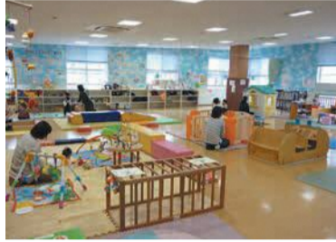
山王子子どもプラザ

■山王子子どもプラザ (山王一丁目13-10) ☎472-6006 日曜、毎月最終月曜、12月28日～1月3日 ■博多南子どもプラザ (竹丘町一丁目4-11) ☎592-9711 土曜、毎月第4金曜、12月29日～1月3日 【共通】 午前10時～午後4時