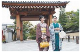
イベント「和の博多」

「和の博多」などの博多の秋を彩るイベントを開催します。また、インスタグラム等のSNSを活用し、観光スポットや見どころといった地域の魅力を幅広い世代に発信します。☎区企画振興課 419-1012 F 434-0053