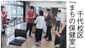
千代校区「まちの保健室」

高齢者が住み慣れた地域で安心して生活を続けられるよう、医療、介護、保健(予防)、生活支援、住まいの各分野のサービス・支援が一体的に提供される「地域包括ケアシステム」の仕組みづくりを進めます。☎区地域保健福祉課 419-1099 F 402-1169