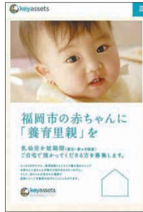
「養育里親」募集のチラシ