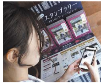
スタンプを集める参加者(昨年)