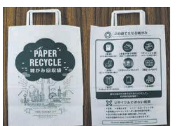
「雑がみ回収促進袋」は区役所などで配布。家庭にある紙袋でも可

や段ボールの他、お菓子の紙箱や包装紙などの「雑がみ」も、紙袋に集めてリサイクルできますII右下写真。