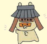
博多の魅力発信会議公認キャラクター「せんねもん」

区ホームページ(「ウォーキングせんねもん」で検索)では、「せんねもん」がウォーキングコースや準備体操の仕方などを動画で紹介しています。