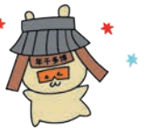
博多の魅力発信キャラクター「せんねもん」

博多の魅力を発信して、令和3年には門をモチーフにしたキャラクター「せんねもん」が誕生し、ホームページなどで博多の魅力を発信しています。