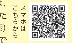
スマホはこちらから