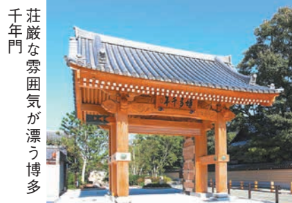
荘厳な雰囲気漂う博多千年門