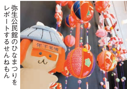
弥生公民館のひなまつりにレポートするせんねもん

博多千年門は、承天寺通りに平成26(2014)年3月に建設された、博多旧市街のシンボルです。江戸時代、この付近に農村部から福岡城下へと通じる道があり、辻堂口門という門が設けられていました。当時、この門から大宰府に続く街道を