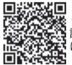
9/25(水)の託児申し込みはこちらから

健（検）診予約は、各健（検）診日の10日前（土・日曜・祝休日を除く）まで。※予約受付日時は平日午前9時～午後5時 ★9/25(水)は託児付き健（検）診です。託児の対象は生後6カ月～未就学児申健（検）診を予約後、②健康課健康づくり係へ電話するか、右コードで申し込みを。