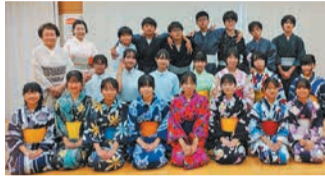
七夕茶会に臨む部員と茶道の先生たち

同部は、25人の部員が火曜日に公民館で活動しています。7月6日に那珂公民館で地域の方を招いて「七夕茶会」を開き、120人をもてなしました。