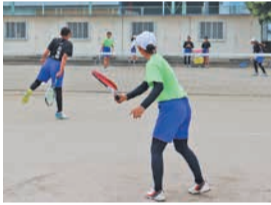
練習でも気を抜かず全力です

優勝を目指すには、みんなの協力が必要不可欠なので、心を一つにして頑張りたいです。