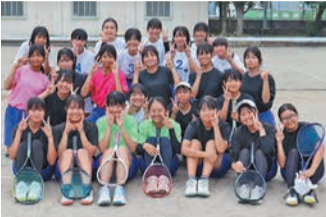
元気なあいさつで迎えてくれた部員たち

同部は、31人の部員が週4日練習に励んでいます。7月に行われた区大会で、団体戦2位、個人戦1位～3位独占という好成績を収めました。次の大会に向けて部員一丸となって、日々の練習に励んでいます。