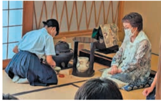
お茶をたてて実践を積み重ねます

お茶会のように多くの人のお茶をたてる時は緊張しますが、お客様の笑顔を見ると達成感を覚えます。今後も茶道を究めていきたいです。