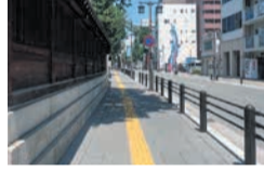
整備後の博多通り

■歴史・文化に配慮した道づくり 博多旧市街エリアの寺社や名所等を巡るルートに石畳風舗装を施すなど、歴史的環境地区にふさわしい、風情のある道路へと整備を進めます。☎区地域整備課 419-1057 📠441-5603