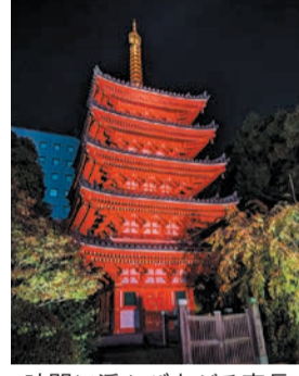
暗闇に浮かび上がる東長寺五重塔(昨年)

長い歴史と伝統文化がある寺社や町並みを幻想的にライトアップする「博多旧市街ライトアップウォーク」など、博多の秋を彩るイベントを開催します。☎区企画振興課 419-1012 📠434-0053