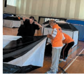
地域の自主防災訓練

■災害に強いまちづくり 博多消防署と連携し、地域で防災研修・訓練を行います。区社会福祉協議会と協力し、自力での避難が困難な人を見守る体制づくりの支援をします。☎区総務課 419-1044 📠452-6735