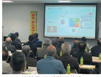
地域防犯活動研修会

■モラルマナーの向上と防犯力の強化 地域や博多警察署と連携した、自主防犯活動の支援や防犯教室の開催などで、地域の防犯力を強化します。☎区総務課 419-1044 📠452-6735 自転車放置禁止区域を中心に、街頭指導員の配置や多言語チラシによる啓発を行い、放置されている自転車を撤去します。☎区管理調整課 419-1071 📠441-5603