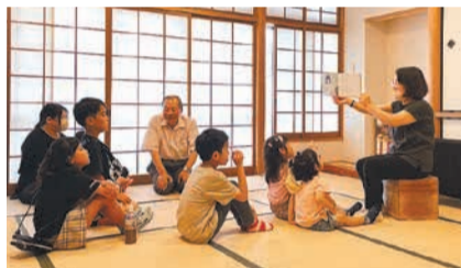
みんなで想像力を豊かにしてお話を聞きます

7月2日に行われた読書の読み聞かせを行いました。本の読み聞かせを行い、子どもたちに本の楽しさを伝えていきます。