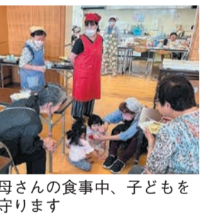
お母さんの食事中、子どもを見守ります

子どもを取り巻く環境は、昔と今とは大きく変化しています。今の子どもたちのことをもっと知りたいと思い、7年前から子ども食堂を開催し、見守ってきました。