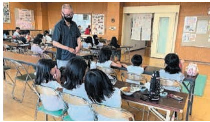
「おいしいね」と仲良くカレーを味わいます

区内の公民館で、マイナンバーカードの申請受け付け (要予約) やマイナポイント申し込みのサポートを行います。詳細は市ホームページ (「福岡市マイナンバーカード申請出張サポート」で検索) でご確認ください。📍市マイナンバーカード申請出張サポートコールセンター ☎600-2402 📠06-7664-9531 (午前9時~午後6時) 📍区内に住む人🆓無料 ※定員に達し次第受け付け終了