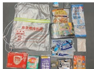
中身の使用期限も点検