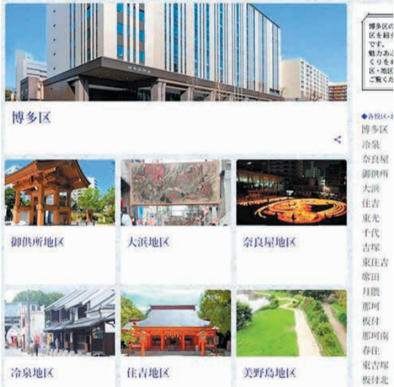
「しっとく博多区」のトップページ