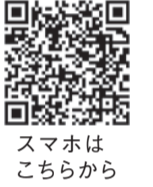
スマホはこちらから

区役所は月~金曜日(祝日除く)に開庁していますが、区役所2階の同コーナーでは、土日祝日も住民票の写しなどが取得できます。マイナンバーカードの受け取りも可能です(要予約)。詳しくは区ホームページ(「博多区役所 証明発行コーナー」で検索)で確認するか、お問い合わせください。