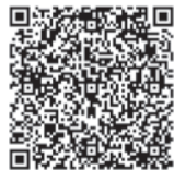
申し込めばこちらから

☎3月11日(土)午後2時~4時 ☎リファレンス 駅東ビル4階(博多駅東一丁目) ☎先着120人 ☎無料 ☎電話か、ファクスまたはメール、右コードの申し込みフォームで▷氏名▷電話番号▷参加人数一を書いて申し込み。