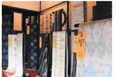
様々な模様の博多織が展示されます。

博多織発祥の地・承天寺(博多駅前一丁目)に集まります。120回を記念して、博多献上(仏具を模した博多織独特の柄)の特別展示を行います。普段は拝観できない境内も見どころの一つです。 11月12日(土)、13日(日) 午前10時～午後5時※13日は午後3時まで 問 博多織工業組合 ☎ 409-5162