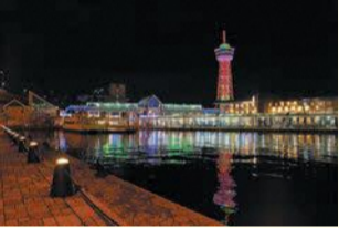
昨年度の入賞作品

フォトコンテスト参加募集中 区内のイベントや美しい風景をテーマに、11月30日(水)まで作品を募集します。インスタグラム(@hakata_miryoku)に投稿するか、メール(hakatanomiryoku@city.fukuoka.lg.jp)または郵送(〒812-8512住所不要)でご応募ください。 問 企画振興課 ☎ 419-1012 ㊟ 434-0053