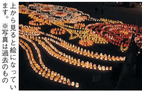
上から見ると絵になっています。※写真は過去のも

☎=日時、開催日、期間 所=場所 問=問い合わせ ☎=電話 ㊟=ファクス 対=対象 定=定員 料=料金、費用 託=託児 申=申し込み 持=持参 電=メール 頁=ホームページ