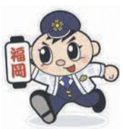
福岡県警マスコット「ふつけい君」