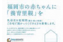
「養育里親」募集のチラシ

養育期間は数日～数カ月程度で、子どもに関する生活費や医療費などは支給されます。詳しくは、下記までお問い合わせください。※本事業は市の委託事業です。