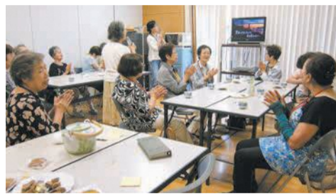
地域のふれあいサロンへの協力も

民生委員・児童委員は、地域から推薦され、厚生労働大臣から委嘱を受けたボランティアです。3月1日現在、区内で358人の委員が活動しています。福祉や子育てなどの相談に応じ、誰もが安心して暮らせるよう、さまざまな支援を行っています。