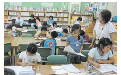
小学校で自習を見守り、子どもたちの学びを支えている地域もあります