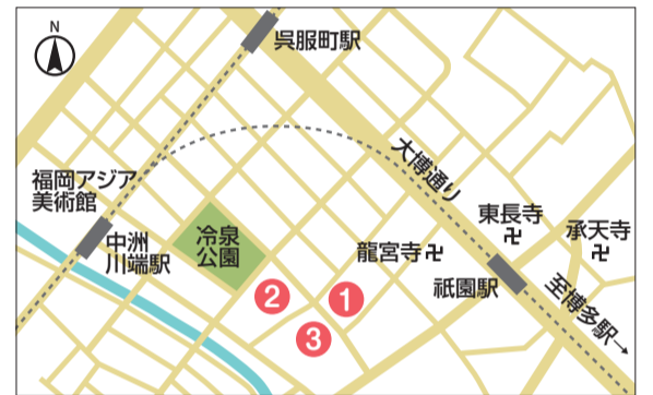
大博通り沿いの大鳥居