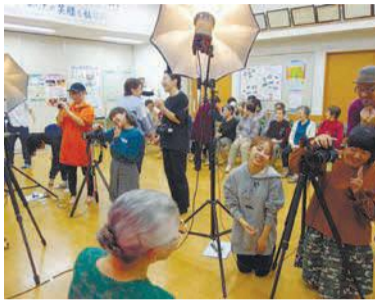
写真を学んでいる学生たちが10月に大浜公民館で撮影会を実施しました。学生は日頃の学びの成果が発揮でき、また参加者は本格的な機材での撮影を体験しました。声を掛けて自然な表情を引き出すなど、終始和やかな雰囲気の中で撮影会は進み、地域との貴重な交流の場となりました。写真。

☎=日時、開催日、期間 所=場所 問=問い合わせ ☎=電話 図=ファクス 対=対象 定=定員 料=料金、費用 託=託児 申=申し込み 持=持参 電=メール 頁=ホームページ