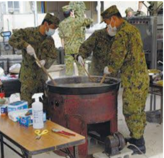
陸上自衛隊の炊き出し

11月17日に月隈小学校で、震度6強の地震発生を想定した防災訓練を実施しました。校区住民をはじめ、警察、陸上自衛隊、区医師会、行政機関など約600人が参加。避難所生活に備えて段ボールベッドの作り方やエコノミークラス症候群の予防方法を学んだり、火災現場を想定した消火訓練を行いました。