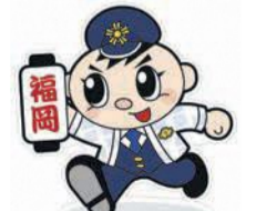
福岡県警マスコットキャラクター「ふっけい君」