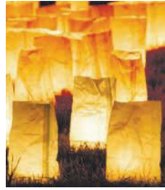
紙袋で作られた灯明(昨年)

【日時】 10月19日(土)午後6時～9時 【開催エリア】 ▷御供所周辺=御供所小学校跡地(御供所町8)・承天寺通り(博多駅前一丁目)▷冷泉周辺=櫛田神社(上川端町1-41)▷奈良屋周辺=博多小学校(奈良屋町1-38)▷大浜周辺=はまかぜ広場(下呉服町10)▷博多リバレイン(下川端町3-1)周辺▷東長寺(御供所町2-4)▷JR博多駅博多駅前広場 【主催】 博多部まちづくり協議会(御供所まちづくり協議会、冷泉まちづくり協議会、奈良屋まちづくり協議会、大浜まちづくり協議会)