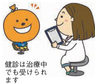
健診は治療中でも受けられます