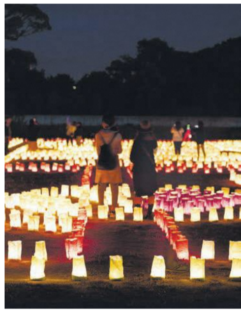
灯明の明かりで普段と違う景色に(昨年)

「博多灯明ウォッチング」は、博多の夜を灯明で照らし出す秋の風物詩です。博多部周辺で30年近く継承されている伝統行事「千灯明」をヒントに、博多っ子たちが協力し合って始めました。商業施設なども賛同するようになり、今回で25回目を迎えます。 博多の名所や旧跡、太閤町割りの通りなどが、手作りの灯明約4万個のほのかな明かりで美しく幻想的に彩られます。