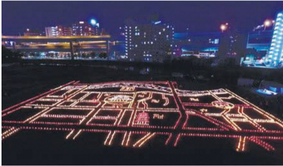
御供所周辺地区の地上絵(昨年)

📅 = 日時、開催日、期間 📍 = 場所 🗨 = 問い合わせ ☎ = 電話 📠 = ファクス 📧 = 対象 📄 = 定員 🏠 = 料金、費用 📞 = 託児 📧 = 申し込み 📧 = 持参 📧 = メール 📄 = ホームページ