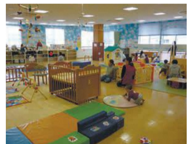
山王子どもプラザ