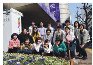
同校の皆さんと区職員

植え替えに参加した生徒は「作業は大変だったけど、完成すると達成感がありました。来庁する人にも楽しんでもらえたらうれしいです」と笑顔で話しました。区役所にお越しの際には、華やかになった花壇をぜひご覧ください。 区企画振興課 問い合わせ先 ☎419-1010 図434-0053