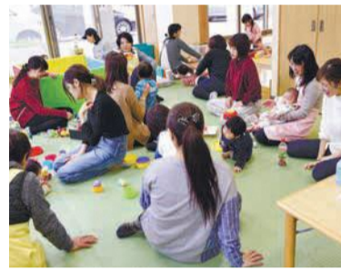
親子でリラックスできる空間

「初めての子育てで不安」「近くに相談相手がない」など、子育てに関する悩みはさまざまです。地域の「子育て交流サロン」や、区内の「子どもプラザ」を紹介します。