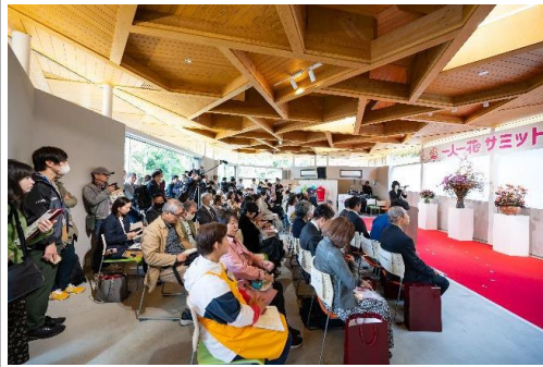
一人一花運動に取り組む方が一堂に集まる場