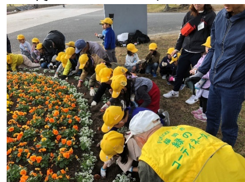
緑化活動の市民リーダーの育成・支援・派遣（認定者数372人(R6.4.1時点)）