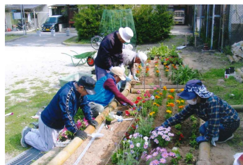
地域の花・森づくり活動に最大20万円助成（認定団体数250(R6.3.31時点)）