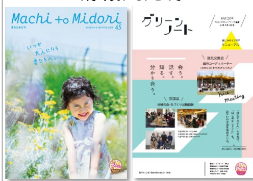
「まちとみどり」年2回発行、 「グリーンノート」毎月発行