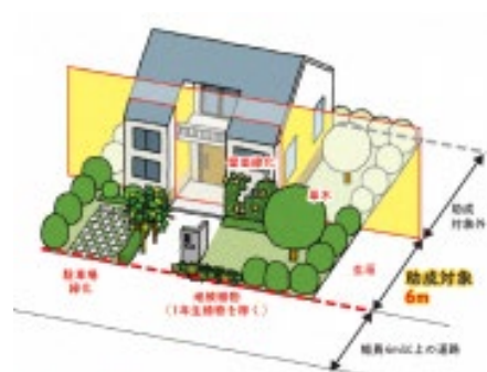
市民の目にふれる民有地の緑化施工費用に最大20万円助成