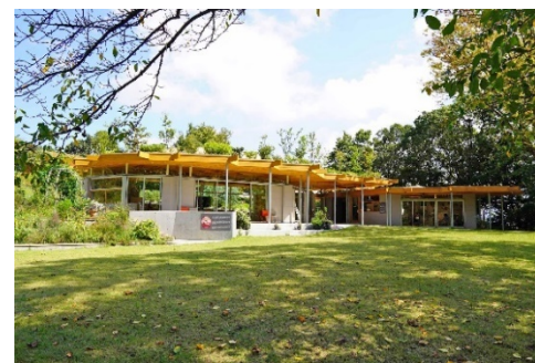
植物園の機能・魅力向上 一人一花運動のさらなる推進 福岡市都市景観賞ラウンドスケープ部門賞受賞