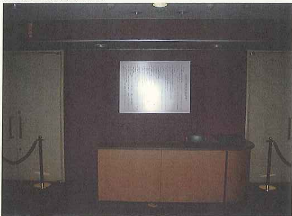
傍聴規則パネル両サイドのスペース95cm