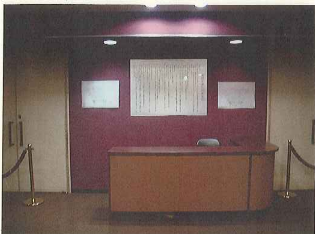
議席図掲示イメージ(A2用紙)