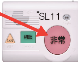
緊急通報機器本体