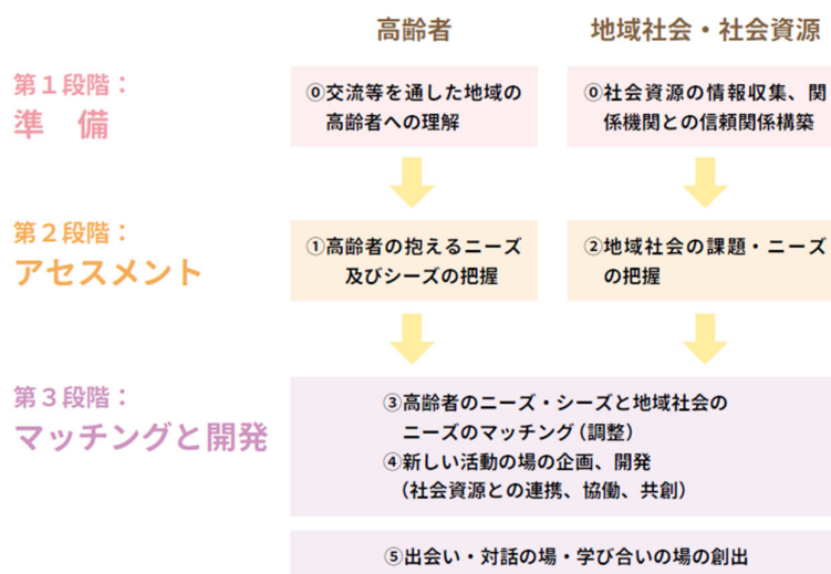
図２ コーディネーションの３つの段階