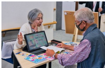
福岡100プラザでの生成AI体験の様子