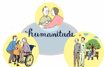
イラスト提供:日本ユマニチュード学会