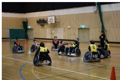
車いすラグビーの様子