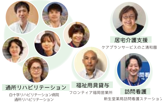
居宅介護支援 ケアプランサービスのご清和園