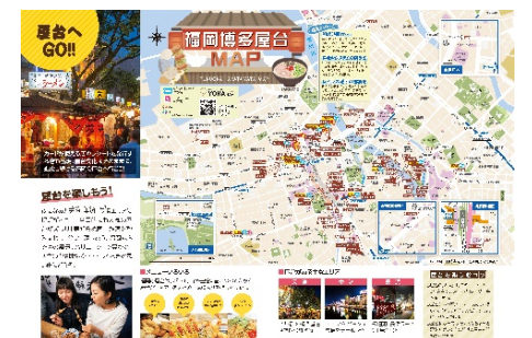
屋台リーフレット (イメージ)

観光情報サイト“よかなび”に掲載している屋台マップに、屋台を利用する際に役立つ情報を追加したリーフレット（紙媒体）を新たに制作中。観光客をターゲットとし、観光案内所や市内ホテルでの配布を予定。