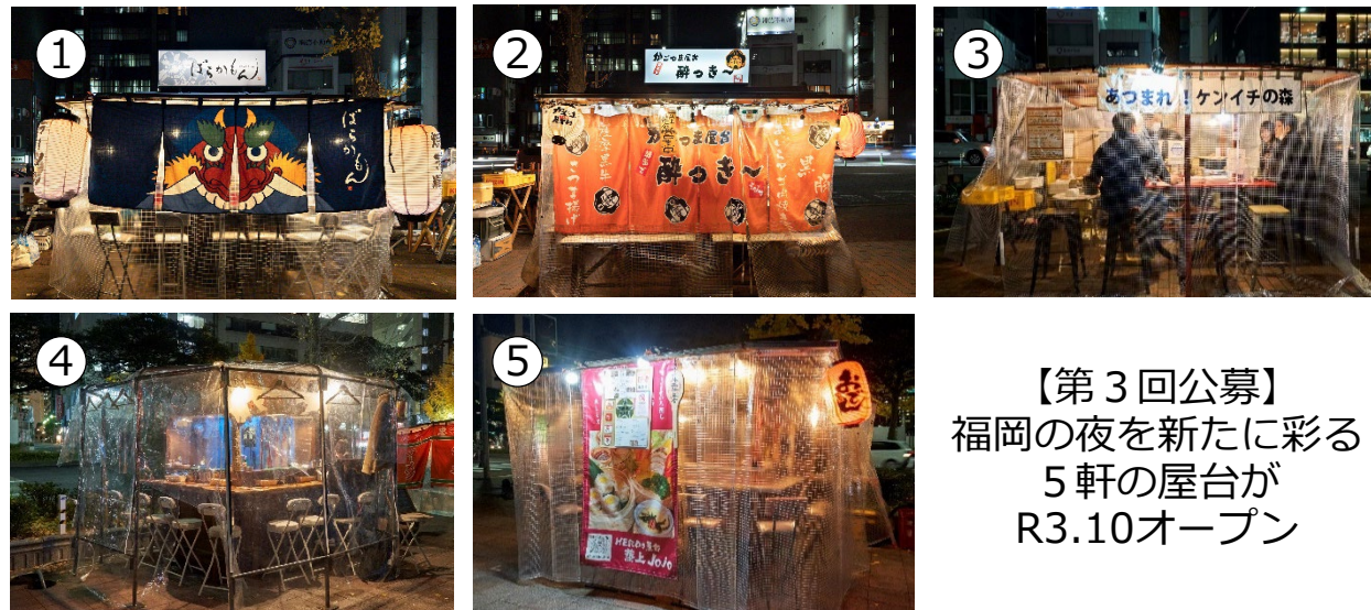
【第3回公募】 福岡の夜を新たに彩る 5軒の屋台が R3.10オープン