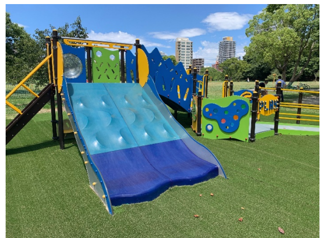
舞鶴公園三の丸広場 インクルーシブな遊具広場内の遊具