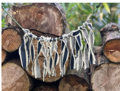
廃デニムのガーランド