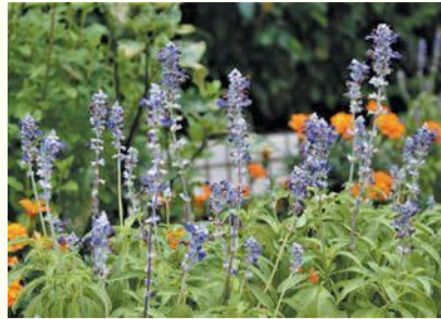
区役所前花壇に咲くブルーサルビア

西区役所 代表電話 ☎881-2131 〒819-8501 西区内浜一丁目4-1 西部出張所 ☎806-0004 〒819-0367 西区西都二丁目1-1