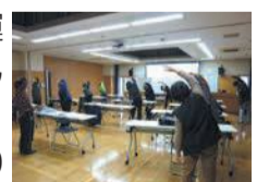
認知症予防の有酸素運動

認知症予防に効果的な運動方法や献立について学んでみませんか。 期9月5日(月)、13日(火)、20日(水)。午前10時～11時半 所 区保健福祉センター講堂 閩区地域保健福祉課 ☎559-5133 ☎512-8811 対65歳以上で運動に支障がなく、全日程に参加可能な人。教室終了後、運動を継続していく意思がある人。その他詳細はお問い合わせください。(定)抽選15人(料)無料(申)7月15日(金)までに電話するかファクスに本紙15面の応募事項を書いて同課へ。