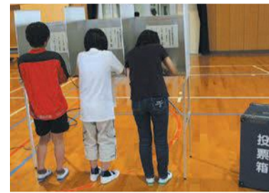
実際の選挙で使う記載台等を使用

子どもたちと選挙の話をする中で、子どもたちが選挙に関心を持ち続ける手助けをしてほしいです」と語りました。