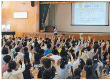
クイズに答えながら知識を深めました

☎=日時、開催日、期間 所=場所 問=問い合わせ ㊟=ファクス 対=対象 定=定員 料=料金、費用 持=持参 託=託児 申=申し込み 電=メール ペ=ホームページ