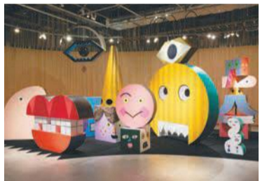
tupera tupera《かおカオス》

『かおノート』『こわめっこしましょ』など顔をテーマにした絵本の原画をはじめ、映像作品『かおつくリズム』や、仕掛けを発見して楽しむ作品『かおカオス』など、会場はさまざまな「かお」でいっぱい。大人も子どもも、「ドッキリ」「ワクワク」が止まらない、「かお」だらけの世界をお楽しみください。