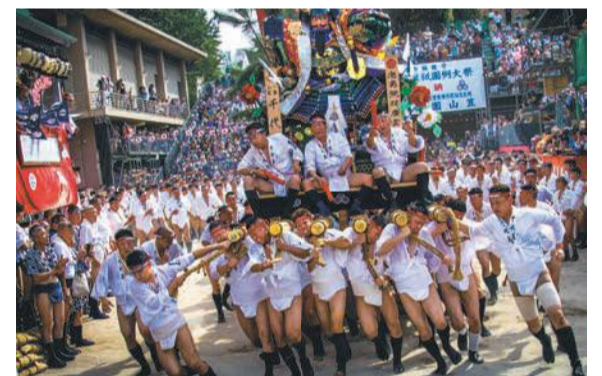
追い山笠馴らし(千代流)