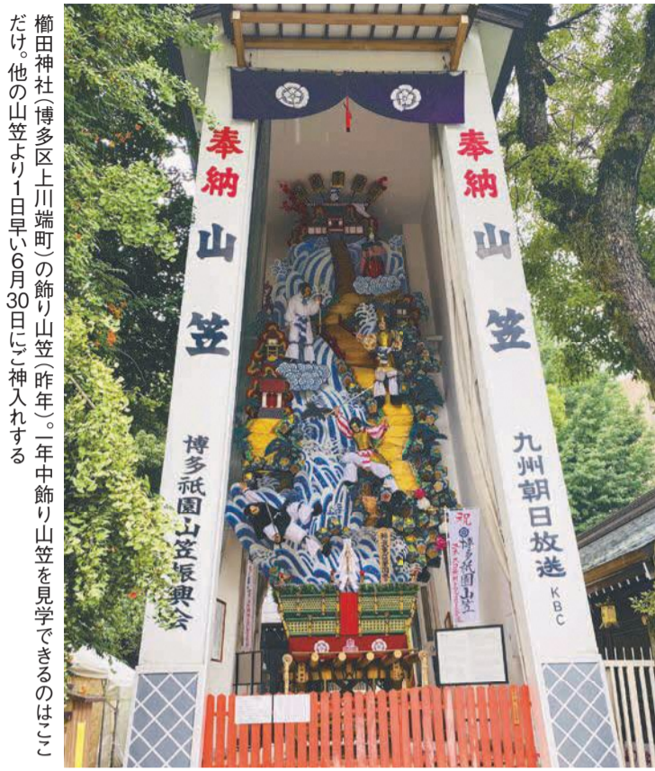
榎田神社(博多区上川端町)の飾り山笠(昨年)。一年中飾り山笠を見学できるのはここだけ。他の山笠より1日早い6月30日に神入れする

新型コロナウイルスの影響で、一昨年、昨年と、苦渋の決断新型コロナウィルスの影響清めたことに由来する祭りで、今年「何が何でも」という