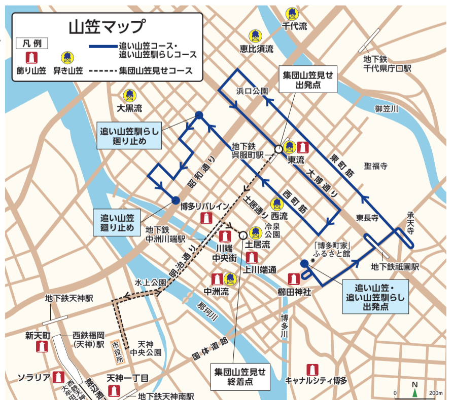
飾り山笠は、上記以外に博多駅商店連合会(JR博多駅博多口)、福岡ドーム(ベイサイドドーム)、渡辺通一丁目(サンセルコ)にもあります

12日(火)の追い山笠馴らしでは、榎田神社から奈良屋町の「廻り止め」まで約4キロを七流が順に昇き出します。