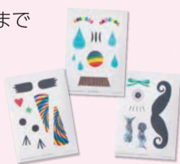
顔に貼って遊べる「かおシール」(全8種)を、会期中1枚220円で販売

所 福岡市美術館2階特別展示室(中央区大濠公園) ☎714-6051 F714-6071 料 一般1,600円、高大生1,100円、小中学生700円 ※金・土曜日の5時半以降に入場すると、一般のみ500円引き。 休 月曜日 ※7月18日(月・祝)は開館、19日(火)は休館