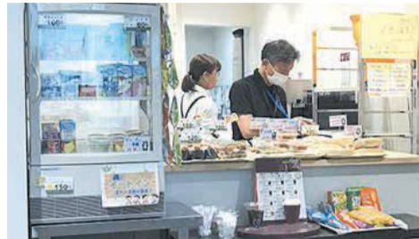
明るい店頭にお弁当や飲料、お菓子が並びます