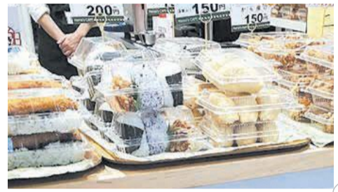
のり弁やおにぎりなど商品の種類が豊富

区役所1階に5月6日、テイクアウト専門の「マズカフェ」が開店しました。立花高等学校(東区和白丘)にあるカフェの支店で、障がい者を支援する事業所が運営しています。コーヒーなどのカフェメニューの他に、パンやおにぎり、唐揚げといった各種総菜を販売しています。